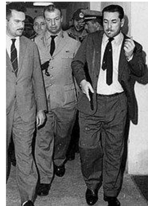
Brizola armado durante o Movimento pela Legalidade, 1961.