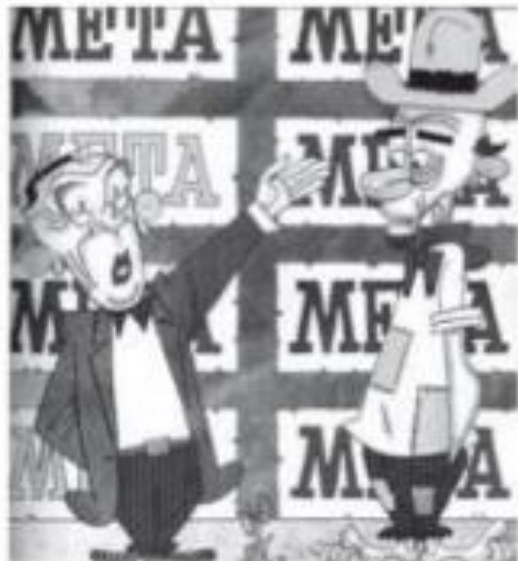
Meta de Faminto

JK — Você agora tem automóvel brasileiro, para correr em estradas pavimentadas com asfalto brasileiro, com gasolina brasileira. Que mais quer?