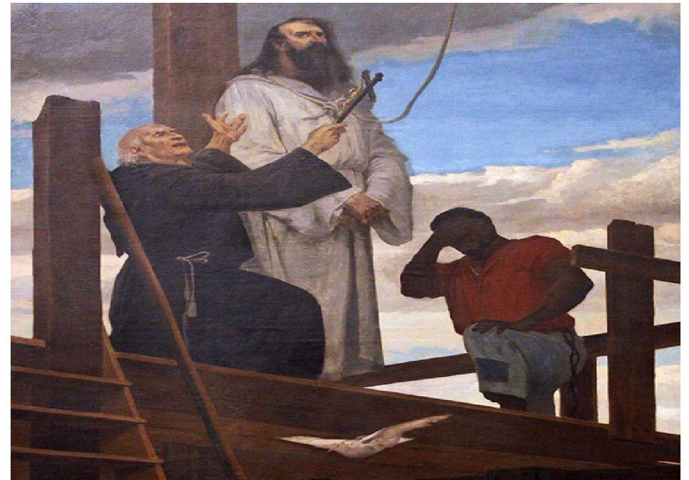
Martírio de Tiradentes, óleo sobre tela de Francisco Aurélio de Figueiredo e Melo (1854 — 1916).