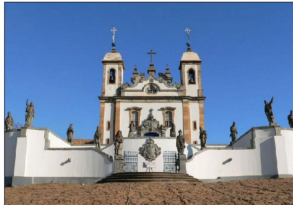
Doze profetas de Aleijadinho