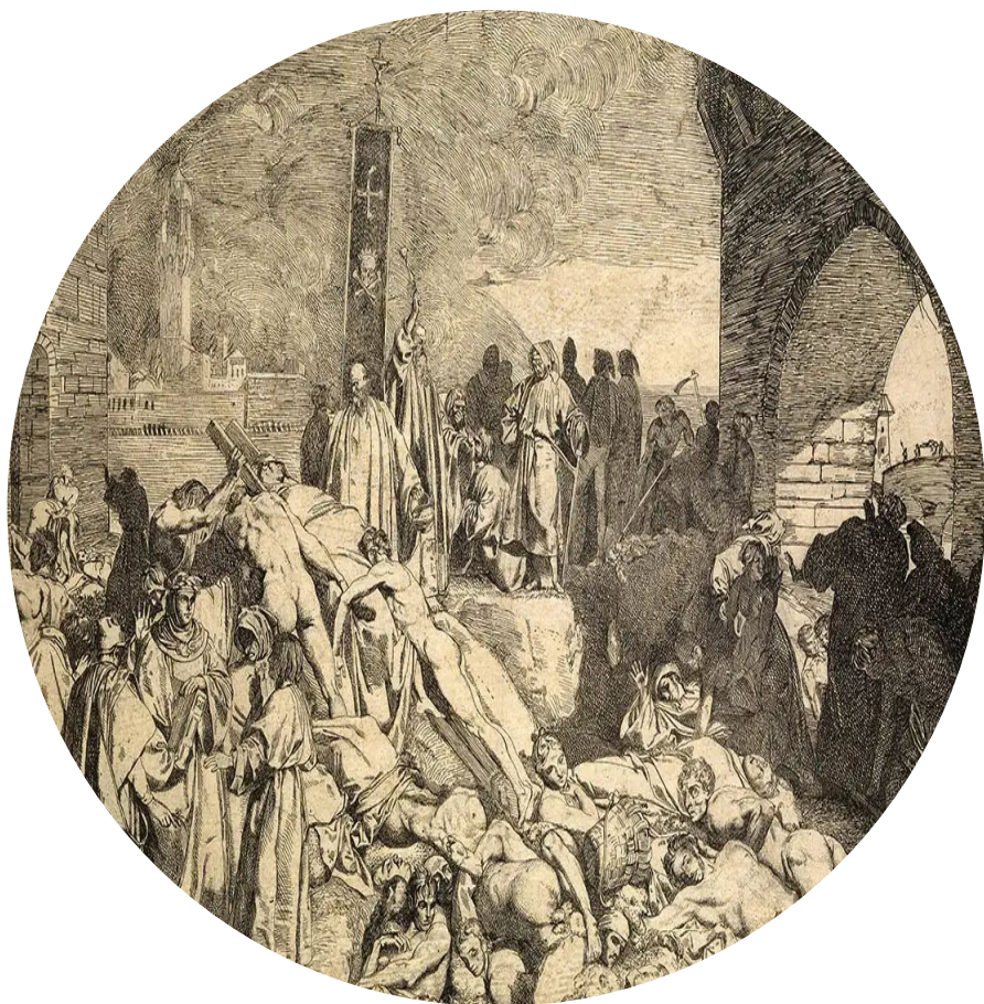
A peste de Florença de 1348