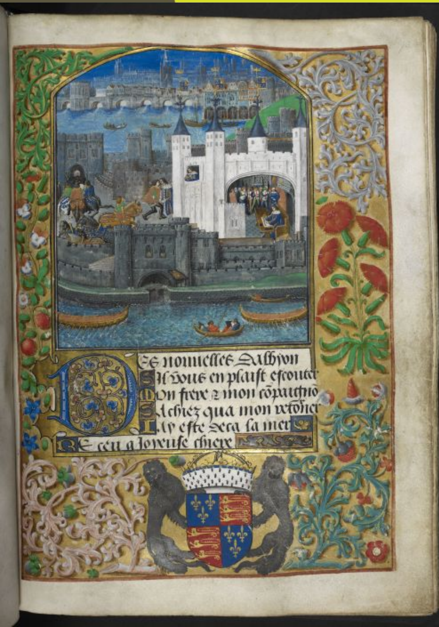
Torre de Londres ~1483