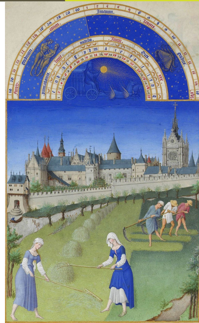
Les très riches heures du duc de Berry ~1412