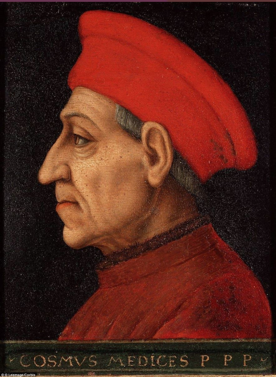
Cosimo de Medici, Bronzino, 1565