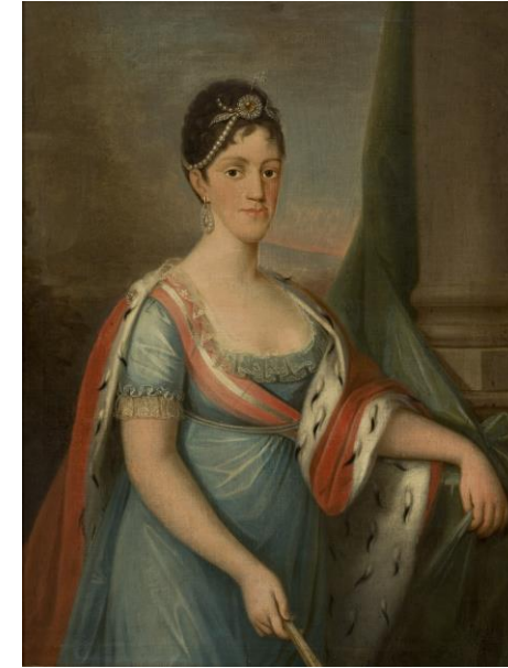
D. Carlota Joaquina, rainha de Portugal, 1802-06. Domingos António de Sequeira