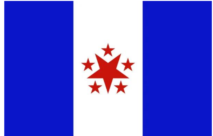
Bandeira elaborada durante a Conjuração Baiana