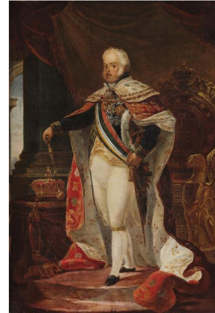
Dom João VI. Pintura de Jean-Baptiste Debret, 1817