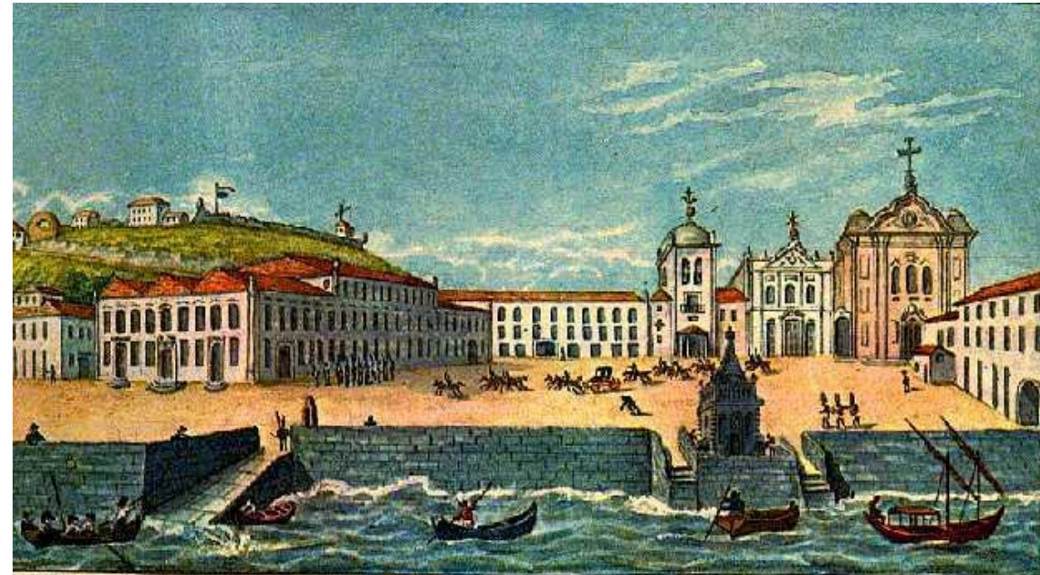
Rio em 1808