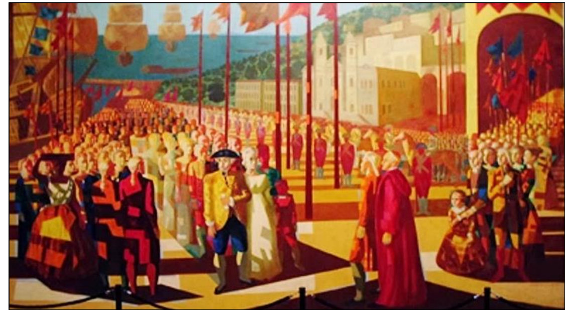
“A chegada de D. João VI a Salvador em 1808 (Portinari, 1952)”