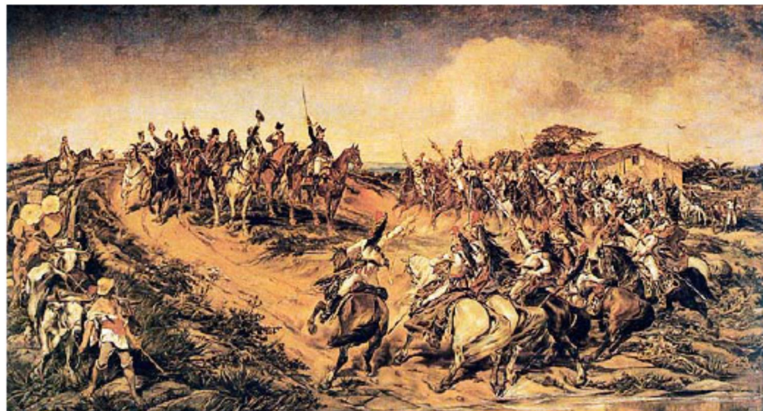
PEDRO AMÉRICO www.dee.ufcg.edu.br

Essa tela foi produzida entre 1886 e 1888, momento de crise do Estado Imperial e de expansão do republicanismo.