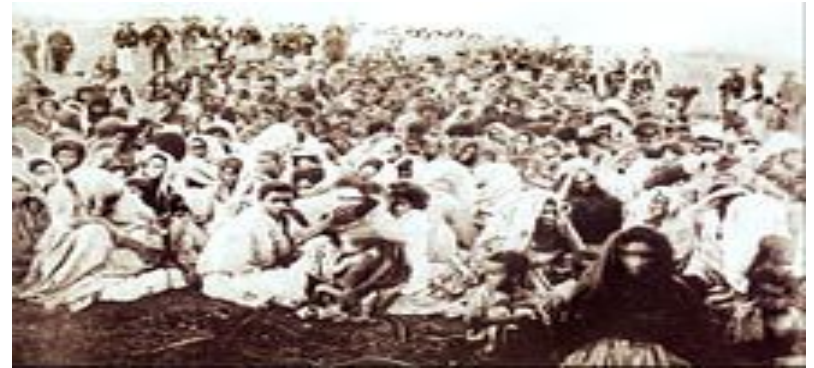
Mulheres e crianças, seguidoras de Antônio Conselheiro, presas durante os últimos dias da guerra.