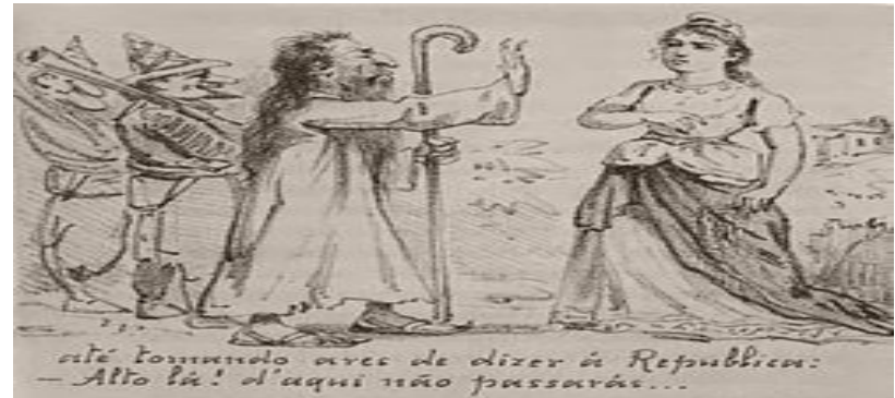
Caricatura na Revista Ilustrada, retratando Antônio Conselheiro, com um séquito de bufões armados com antigos bacamartes, tentando "barrar" a República.