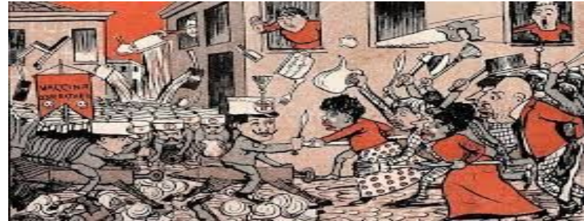
Caricatura feita por Leonidas e publicada no Jornal o Malho em outubro de 1904.

Consequências: Vários bondes destruídos na cidade do Rio de Janeiro, o governo dominou os revoltoso pela polícia, deixando mais de 100 feridos e 30 mortos;