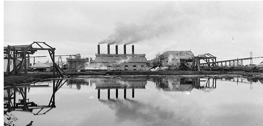
Serraria Lumber, maior da América do Sul na época, pertencia ao empresário americano Percival Farquac.