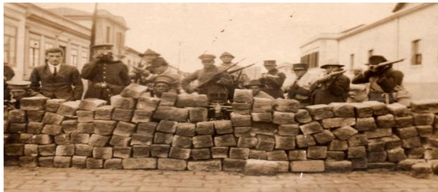
Os revoltosos paulistas entrincheirados.

Consequências: As tropas foram obrigadas a recuar pelo avanço das forças do governo, formando assim a Coluna Paulista que seguiu em direção ao Sul do país para se unir as forças lideradas por Luís Carlos Prestes;