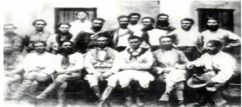
Comando da Coluna. Luís Carlos Prestes é o terceiro sentado, da esquerda para a direita.

Consequências: Foram perseguidos incessantemente por tropas do governo, até desfazerem a tropa na Bolívia; Prestes fica no exílio até ser convertido ao comunismo e voltar ao país;