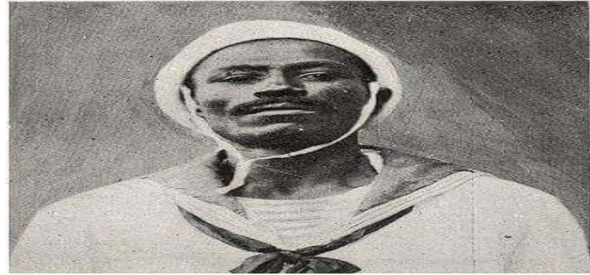
Fotografia de João Cândido.

Consequências: As promessa não foram cumpridas pelo Governo, ao tentaram tomar novamente os encouraçados os marinheiros foram presos e muitos deportados para a Amazônia, João Cândido foi preso em uma masmorra na Ilha das Cobras e absolvido em 1912;