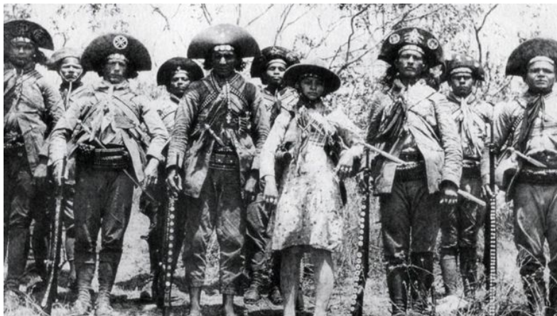
O "bando" de Lampião.