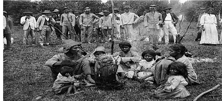
Família de sertanejos se rende às forças oficiais em Canoinhas (SC), em 1915

Consequências: Os sertanejos do Contestado foram violentamente perseguidos pelos coronéis, donos de empresas estrangeiras com apoio das tropas do governo (aviões foram usados pela primeira vez em combate no Brasil) ; Os núcleos de Monarquia Celeste foram sendo combatidos e destruídos pouco a pouco.