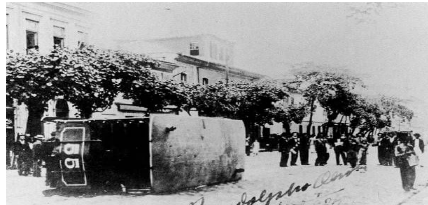
Fotografia de Bondes tombados durante a Revolta.