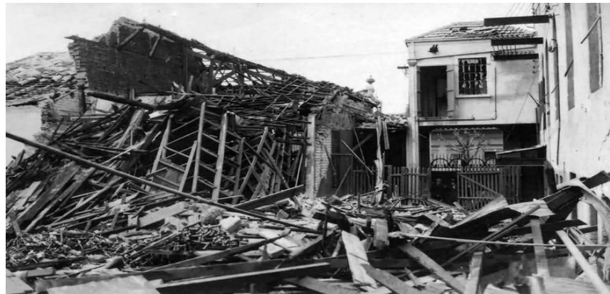
Destrução em São Paulo.