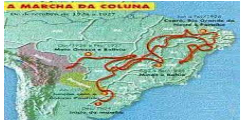
A Marcha da Coluna.