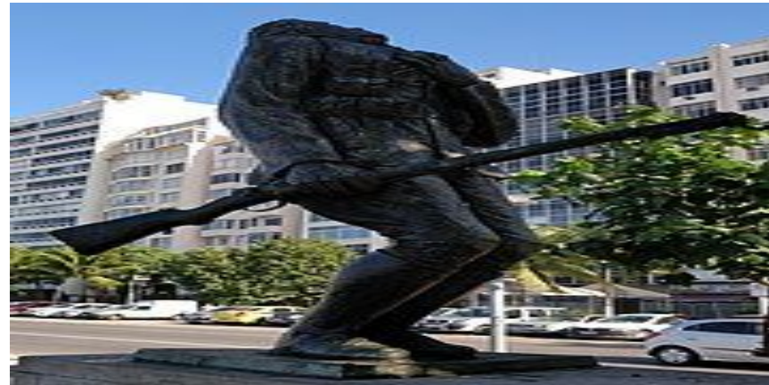
Estátua de Siqueira Campos, representando o momento em que foi alvejado.