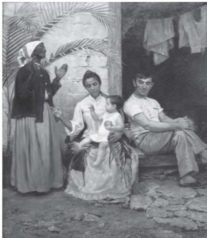
BROCOS, R. A redenção de Cam, 1895.

Disponível em: http://mnba.gov.br . Acesso em: 13 jan. 2013.