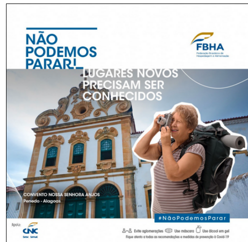
Campanha da Federação Brasileira de Hospedagem e Alimentação para retomada do segmento após a pandemia de Covid-19.

Do ponto de vista discursivo, merece especial atenção o emprego da 1ª pessoa do plural ( nós ) ou mesmo de seu correspondente a gente . Tal uso pode configurar uma estratégia discursiva de convencimento por parte de quem fala, a partir da associação com seu interlocutor.